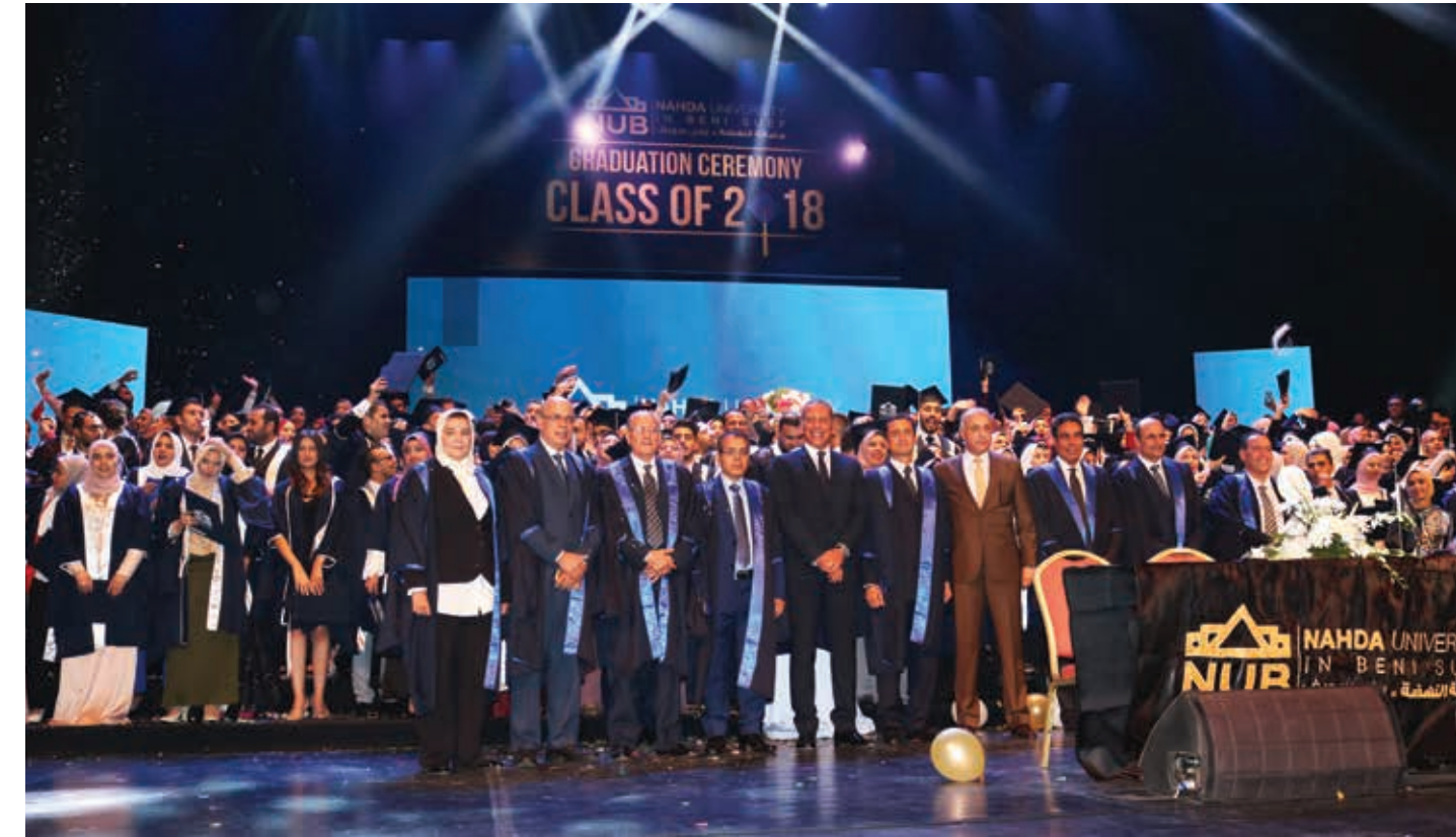
حفل تخرج دفعة ٢٠١٨