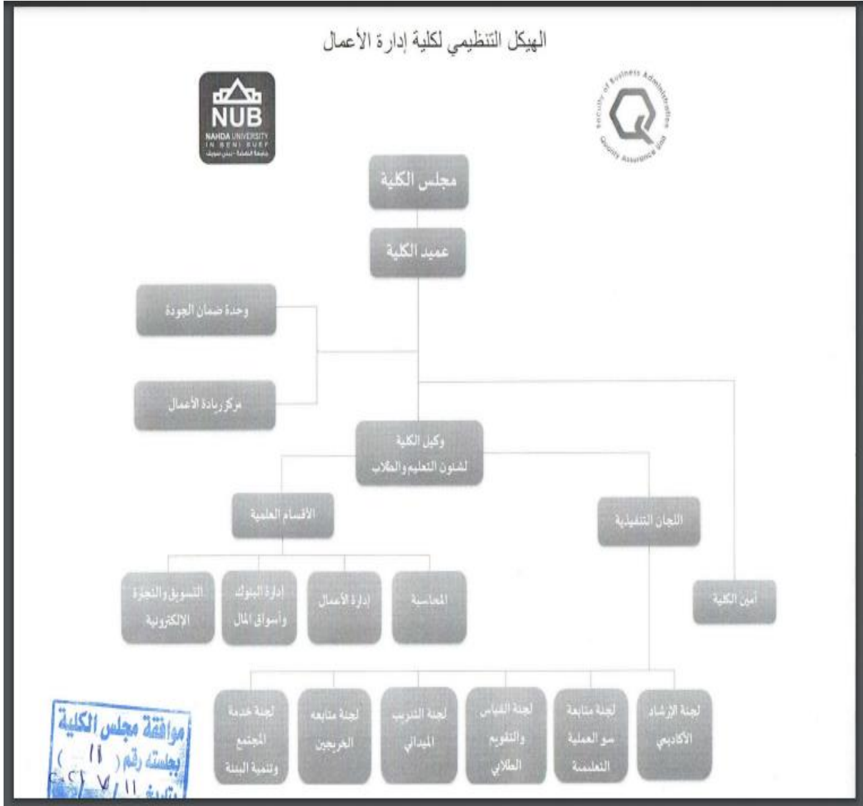
شكل رقم (1) الهيكل التنظيمي لكلية إدارة الأعمال